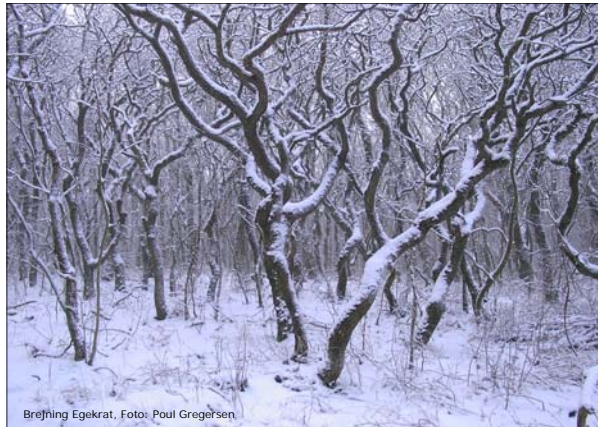
Brejning Egekrat

Brejning egekrat ligger øst for Brejninggård mellem Spjald og Videbæk.