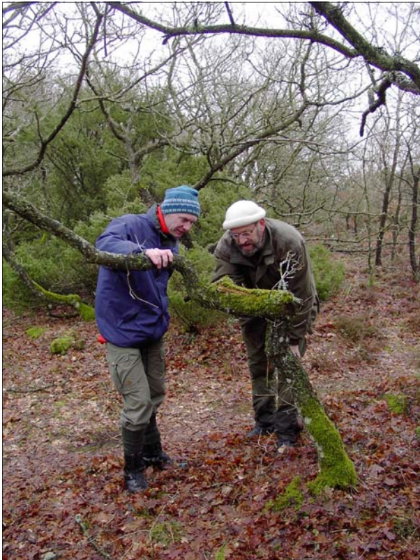
Brejning Egekrat, Foto: Poul Gregersen

I Midt og Vestjylland findes flere hundrede egekrat, der er rester af de skove, som for flere tusinde år siden dækkede næsten hele Danmark.