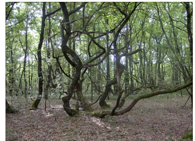
Brejning Egekrat, Foto: Poul Gregersen

Gennem mange århundreder drev bønderne egekrattene som "stævningsskov". Rodskuddene fra de gamle ege blev tyndet ud i flere omgange . Først til kviste i risgærder, senere når de var tykke nok til skafter til møggrebe og høtyve og til sidst til bygningstømmer.