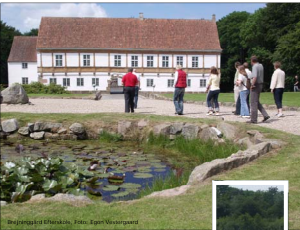
Brejninggård Efterskole