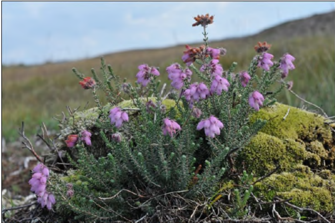
Klokkelyng er en af karakter-arterne for naturtypen våd hede.