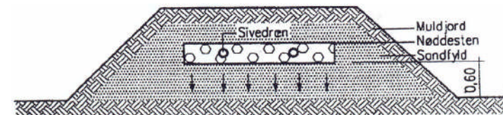
Figur 3: Udsnit af et jordhøjsanlæg/sandmoleanlæg.

Generelt: Tryk-/pumpesystemet sikrer en god spildevandsfordeling. Anlægget kan med fordel anvendes i område med høj grundvandsstand, hvor spildevandet skal pumpes til en sandmile, også kaldet et jordhøjsanlæg.