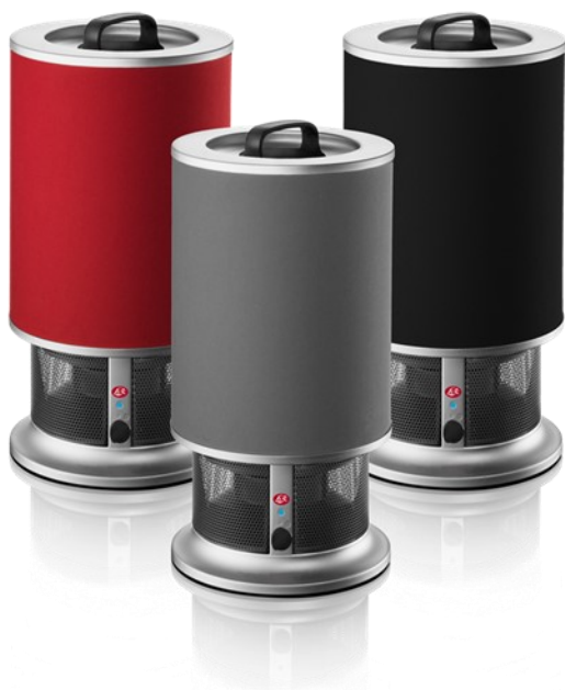
AeroGuard Mini fra firmaet Nordic2Care

Ønsker man ikke at gøre noget ved udfordringen og man modtager hjælp og pleje, så er den politiske beslutning, at man kun kan modtage minimums pleje, hvilket vil sige livsnødvendig pleje.