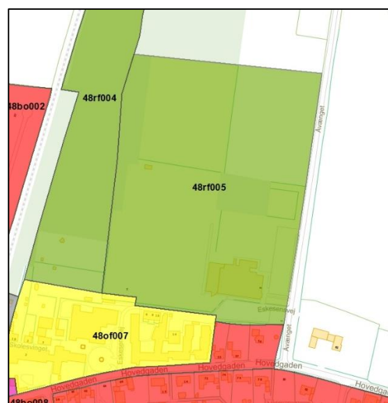
Kortbilag 1 (Eksisterende rammeområde)