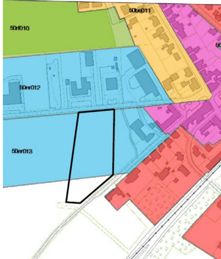
Kortbilag 2 (Nyt rammeområde)