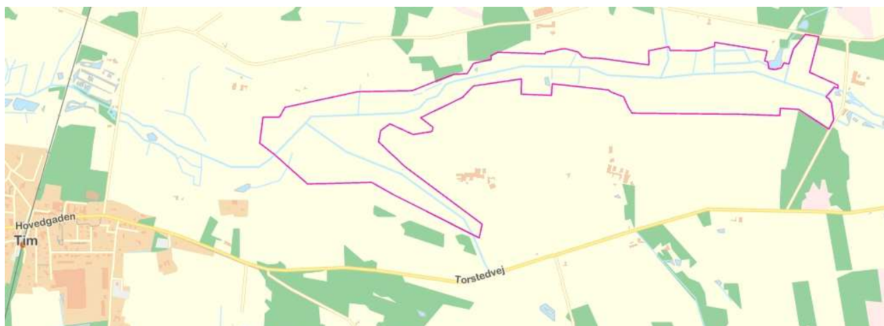
Fig. 1 Det 90,7 ha store projektområde - Tm Å Lavbundsprojekt

Ringkøbing-Skjern kommune fik januar 2020 tilsagn fra Landbrugsstyrelsen til at udarbejde en forundersøgelse på et lavbundsprojekt øst for Tim by. Et lavbundsprojekt har til formål at reducere CO 2 udledningen fra kulstofrige landbrugsjorde, samt forbedre natur og vandmiljø ved ekstensivering af drift på dyrkede arealer. Forundersøgelsen består af en teknisk og en ejendomsmæssig forundersøgelse.