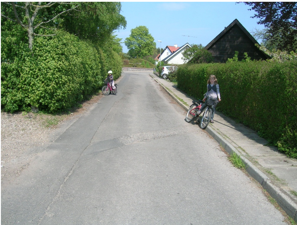
Eksempel 2. Trafikklasse T1 Restlevetid: 29 %