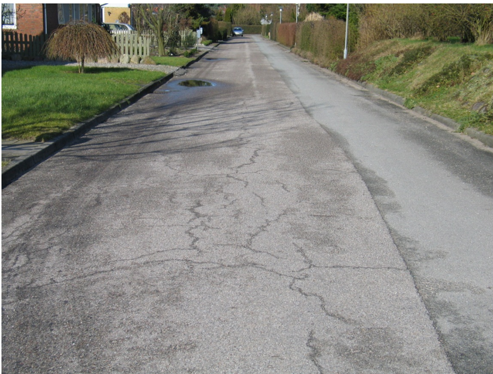
Eksempel 1. Trafikklasse T2 let Restlevetid: 33 %