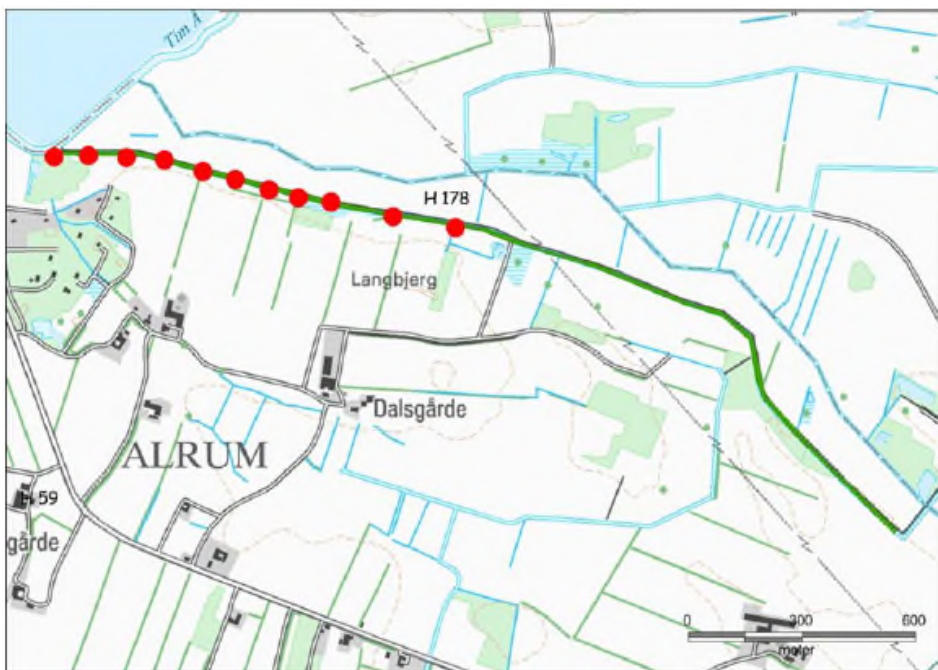
Forekomst af vandranke i Kimmelkær Landkanal på de nederste ca. 1 km inden udløbet i Tim Engso.